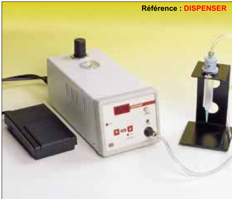
Référence : DISPENSER