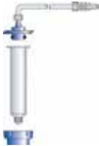
Adaptateur de seringue série 400